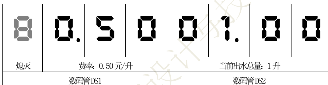
图 2. 售水机出水状态数码管显示