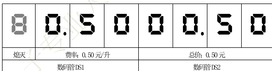
图 3. 售水机出停水态数码管显示